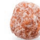
MIGDAŁY POD PALMĄ ALMOND WITH COCONUT