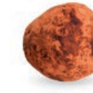
ŻURAWINA NA CZARNYM ŁĄDZIE CRANBERRY WITH COCOA