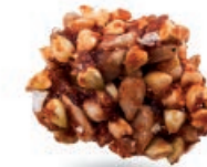
GRYCZANKI MIODOWE HONEY