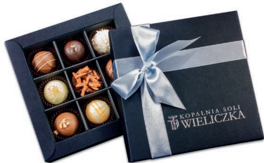
07.09 Bombonierka Mars Waga netto: ok. 100 g Wymiary opakowania: 140 x 140 x 43 mm Minimalne zamówienie: 50 szt.

07.09 Mars box Net weight: ca. 100 g Box size: 140 x 140 x 43 mm Minimum order: 50 pcs.