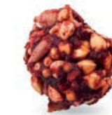
GRYCZANKI LEŚNE FOREST FRUIT