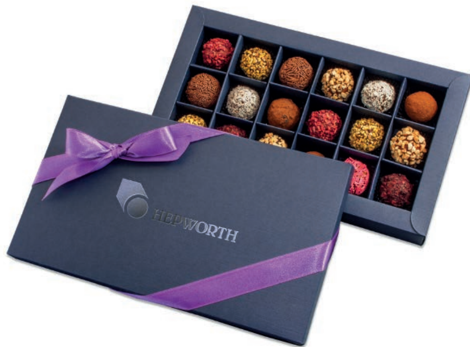
07.39 Bomb. Marcepanowa Premium Waga netto: ok. 200 g Wymiary opakowania: 238 x 136 x 43 mm Minimalne zamówienie: 50 szt.

07.09 Mars box Net weight: ca. 100 g Box size: 140 x 140 x 43 mm Minimum order: 50 pcs.