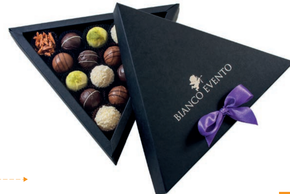
07.16 Bombonierka Dione Waga netto: ok. 160 g Wymiary opakowania: 215 x 188 x 32 mm Minimalne zamówienie: 50 szt.

07.16 Dione box Net weight: ca. 160 g Box size: 215 x 188 x 32 mm Minimum order: 50 pcs.