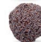
FIGA Z MAKIEM FIGS WITH POPPY SEEDS