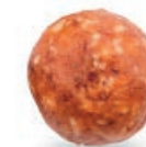
ŁATWY ORZECH DO ZGRZYBIENIA NUT