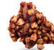
GRYCZANKI CZEKOLADOWE CHOCOLATE