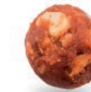
ORZECHOWY SEN O CYNAMONIE NUT WITH CINNAMON